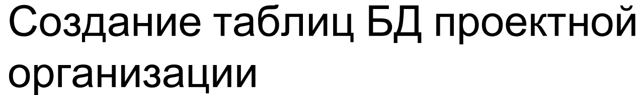
Таблица «Проекты» (Project):

create table project (No number(5) constraint pk_project primary key , title varchar2(200) not null, pro varchar(15) not null constraint pro_uniq unique , client varchar(100) not null, dbegin date not null, dend date not null, cost number(9) );